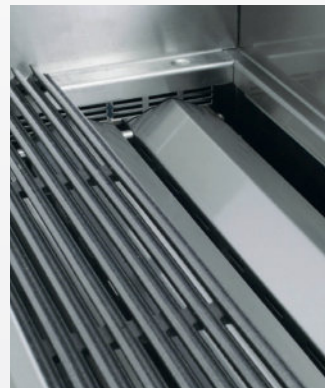
Umlenkbleche für Brenner

Das gusseiserne Rost ist abnehmbar und zudem beidseitig verwendbar. Eine Seite mit angeschrägtem Rost und Abflussrinnen dient der Zubereitung von Fleisch mit hohem Fettgehalt, damit das Bratenfett einfacher abfließen kann. Die andere Seite ist horizontal und großflächig nutzbar und somit für die Zubereitung von Fisch, Gemüse oder auch Hamburgern vorgesehen.